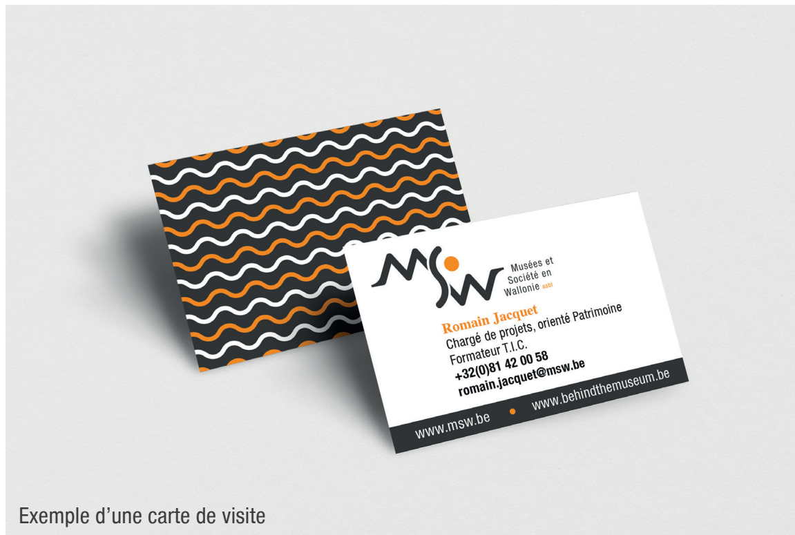
Exemple d'une carte de visite