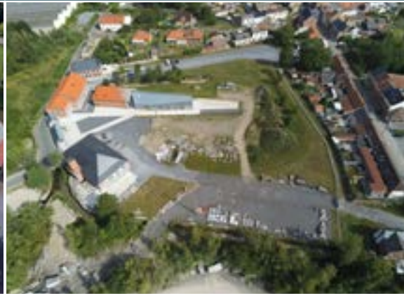
Vue aérienne du Pôle de la Pierre à Soignies