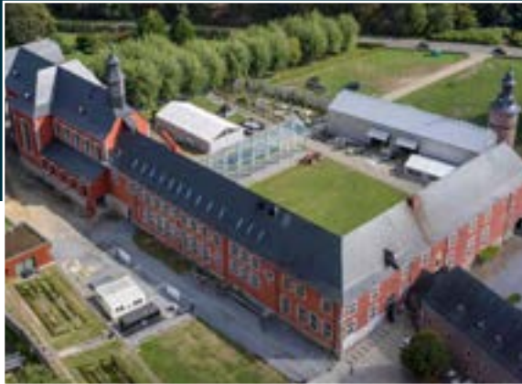
Vue aérienne du Centre des Métiers du Patrimoine « la Paix-Dieu » à Amay.